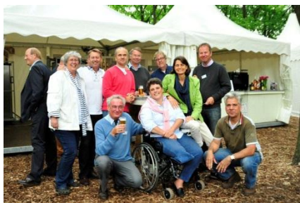
Enkele leden van de Kiwanis Club Laren en het bestuur van de stichting.

Deze tegenvallers konden wij niet uit onze reguliere sponsorbijdragen financieren. Er is massaal op de brandbrief gereageerd. Wij hebben in totaal € 11.918,95 mogen ontvangen en wij willen dan ook ieder heel hartelijk bedanken voor jullie bijdrage. M.n. de Kiwanis Club Laren, The Carbon Directory en een anonieme sponsor uit Volendam.